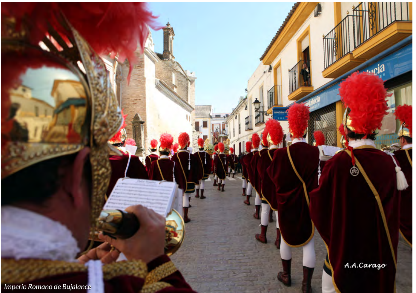
Imperio Romano de Bujalance