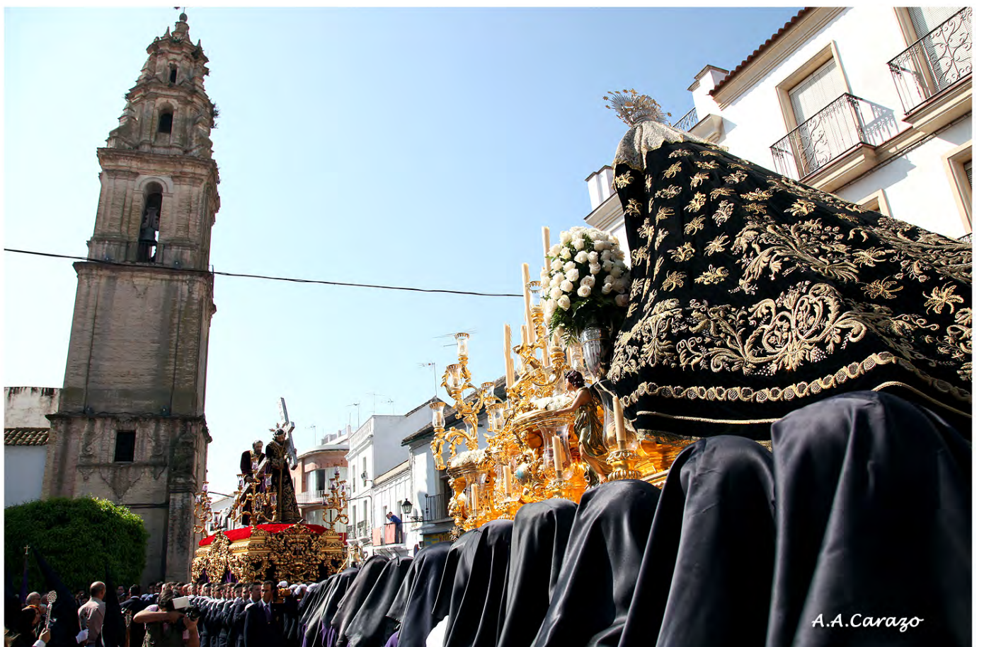
Momento de nuestra "madrugá"