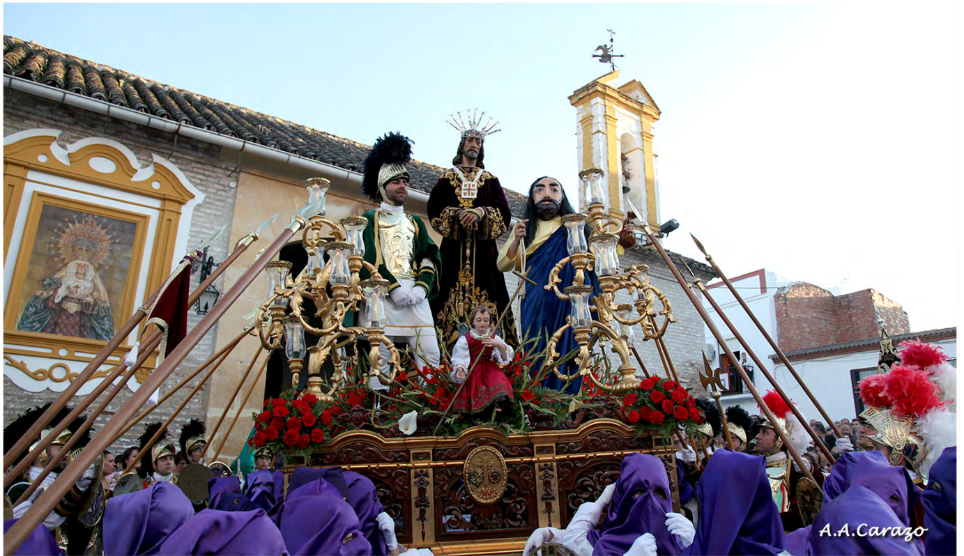
Prendimiento de Ntro. Padre Jesús Rescatado