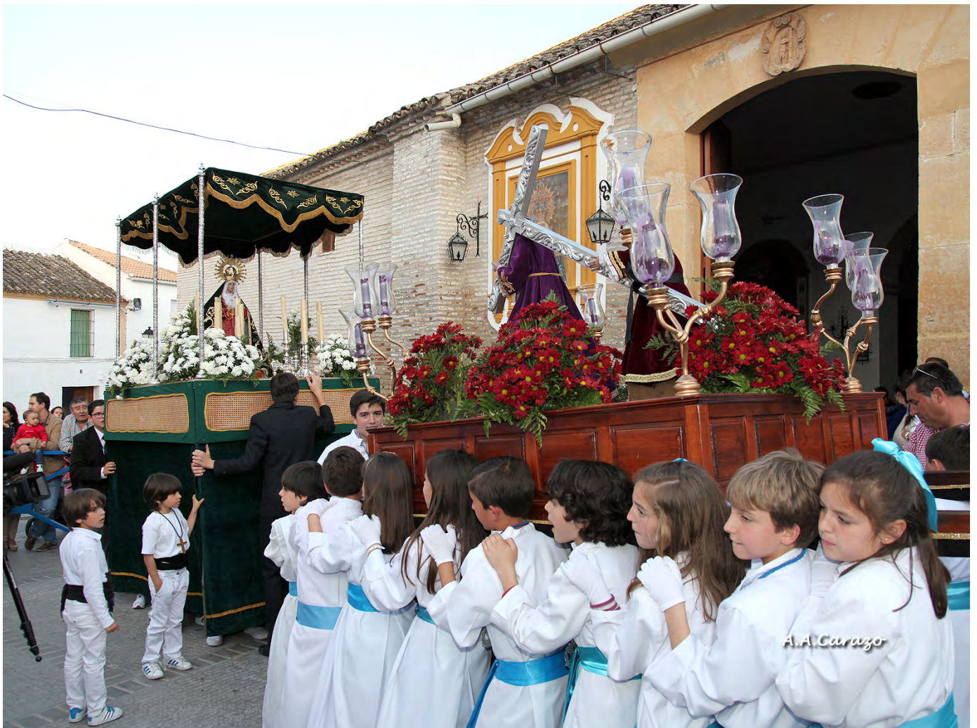
Semana Santa Chiquita