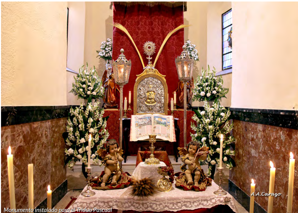
Monumento instalado para el Triduo Pascual

Por último agradecer en primer lugar a los miembros de la actual junta de gobierno por su apoyo en estos tres últimos años, a todas las cofradías y hermandades, a todos los negocios y empresas que un año más siguen apoyando nuestra Semana Santa, así como al Excmo. Ayuntamiento de Bujalance y la Excmo. Diputación de Córdoba.