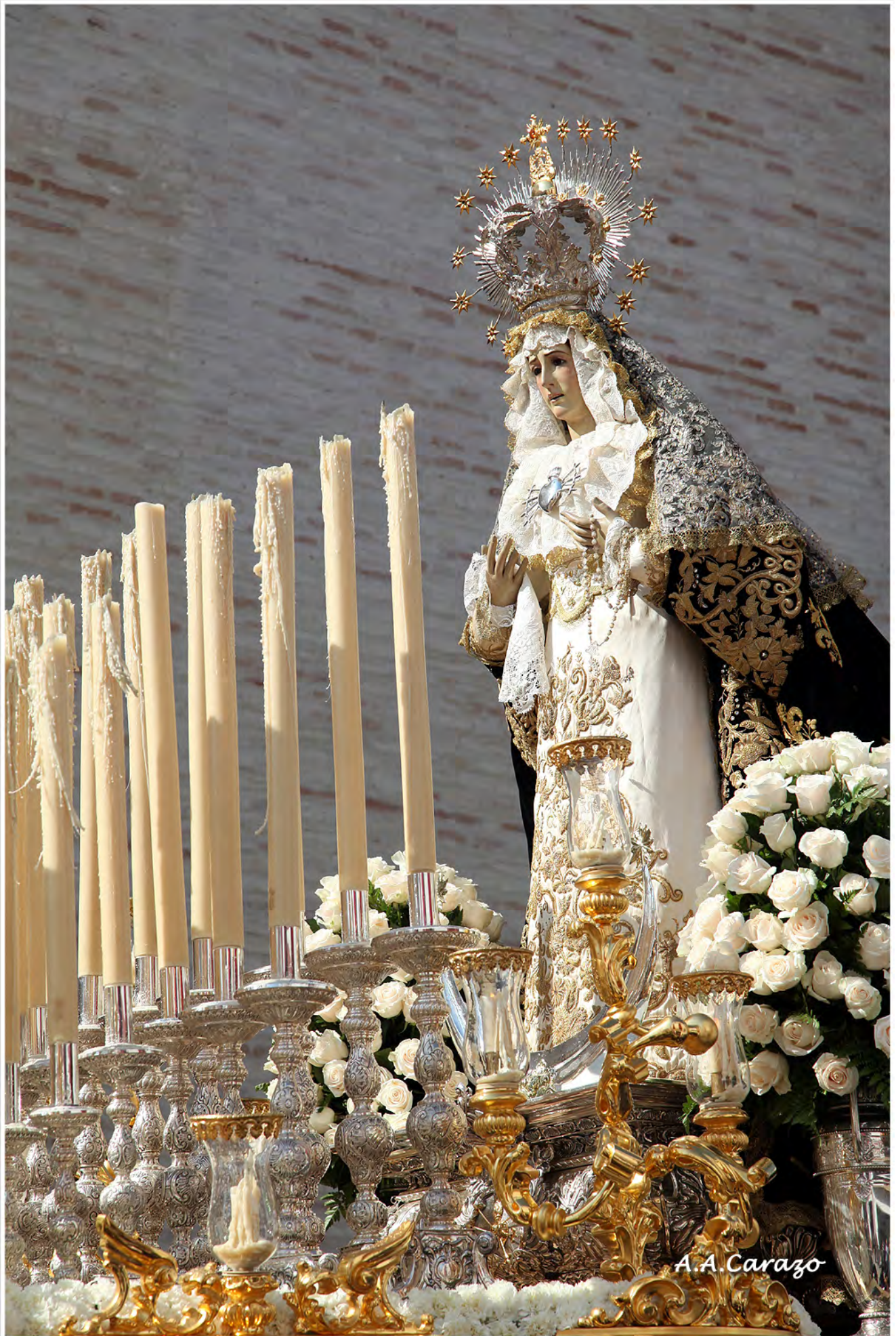
Ntra. Sra de los Dolores