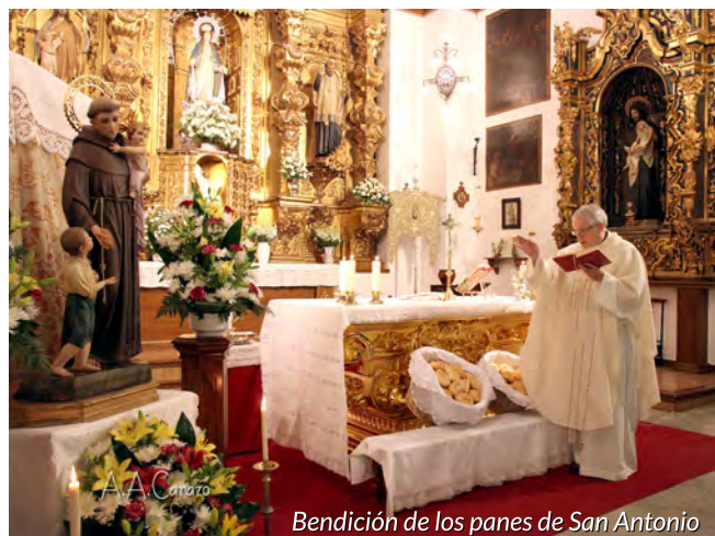
Bendición de los panes de San Antonio

Miembro de la Junta de Gobierno de la Hermandad