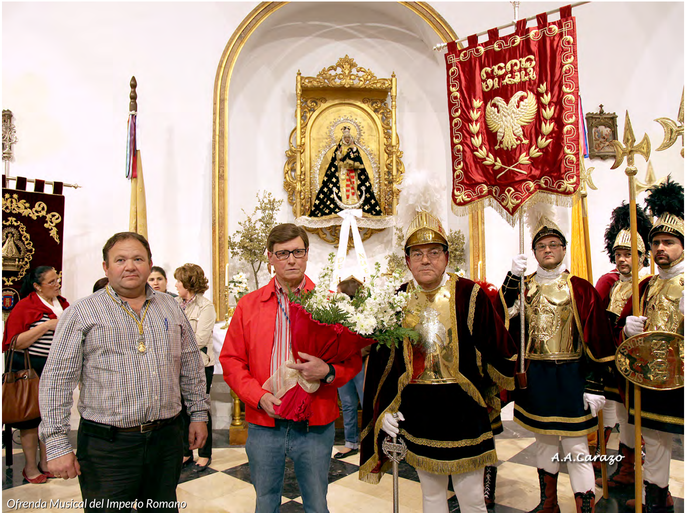
Ofrenda Musical del Imperio Romano