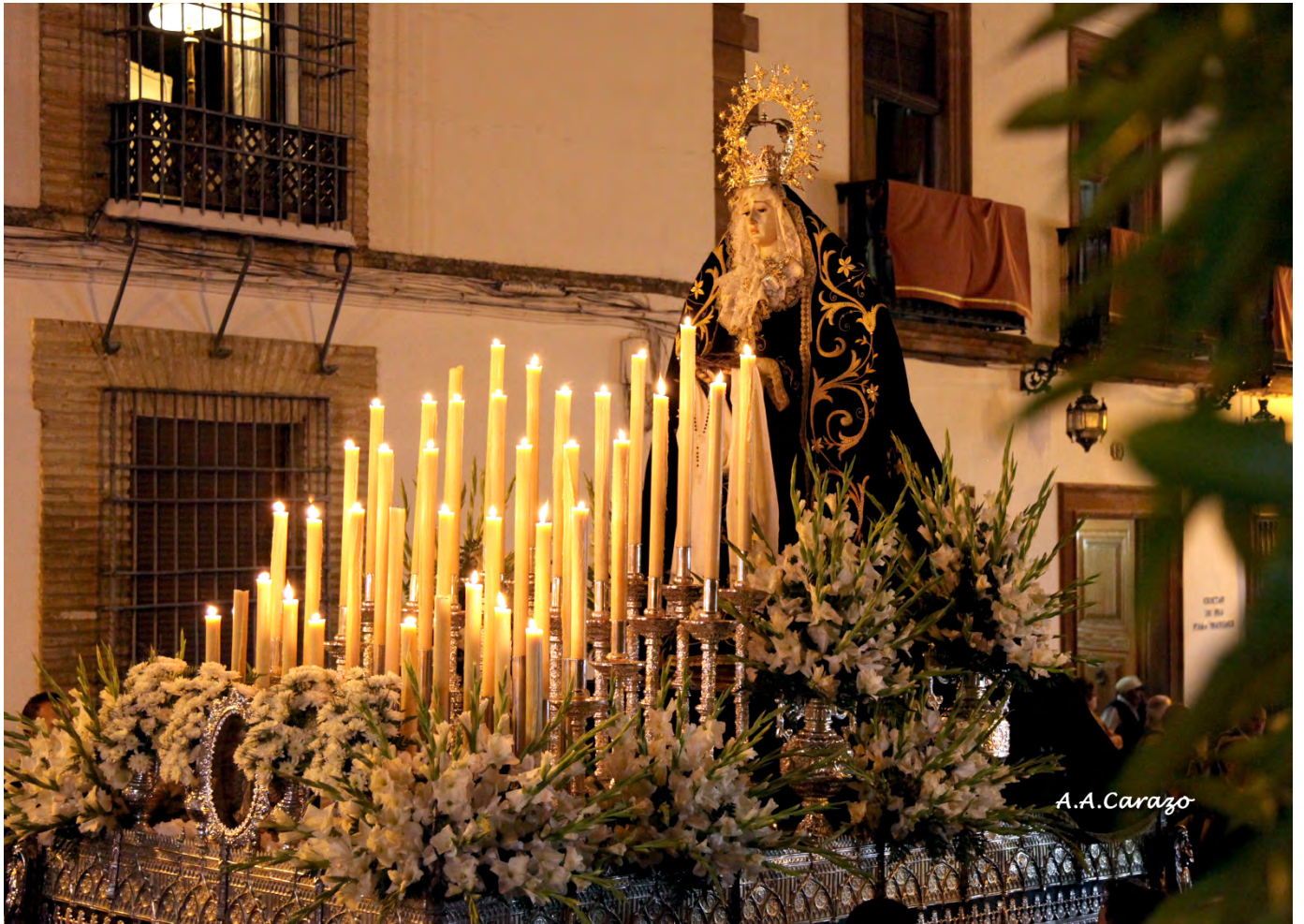
Ntra. Sra. de la Soledad