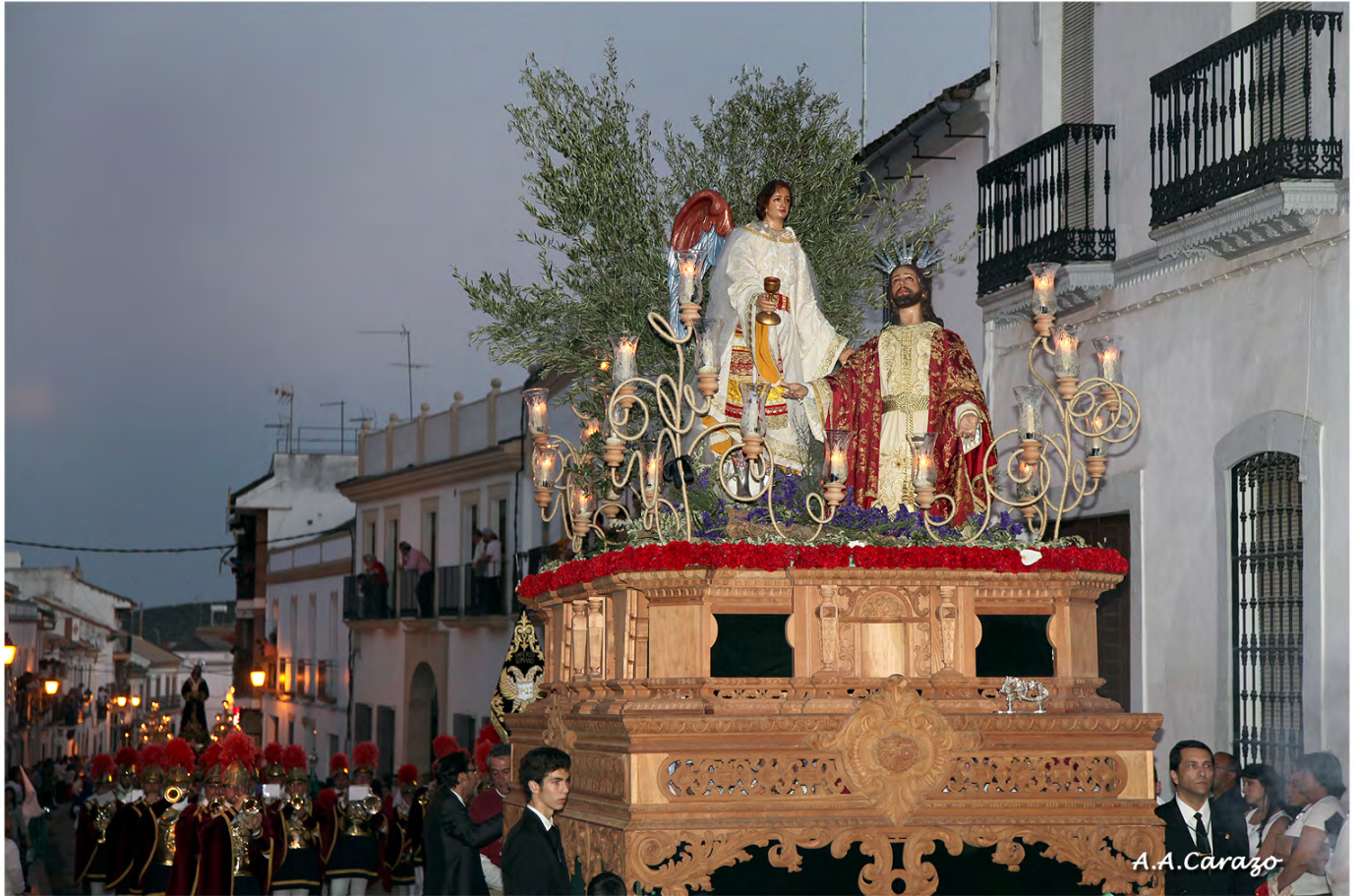
Ntro. Padre Jesús de la Oración en el Huerto