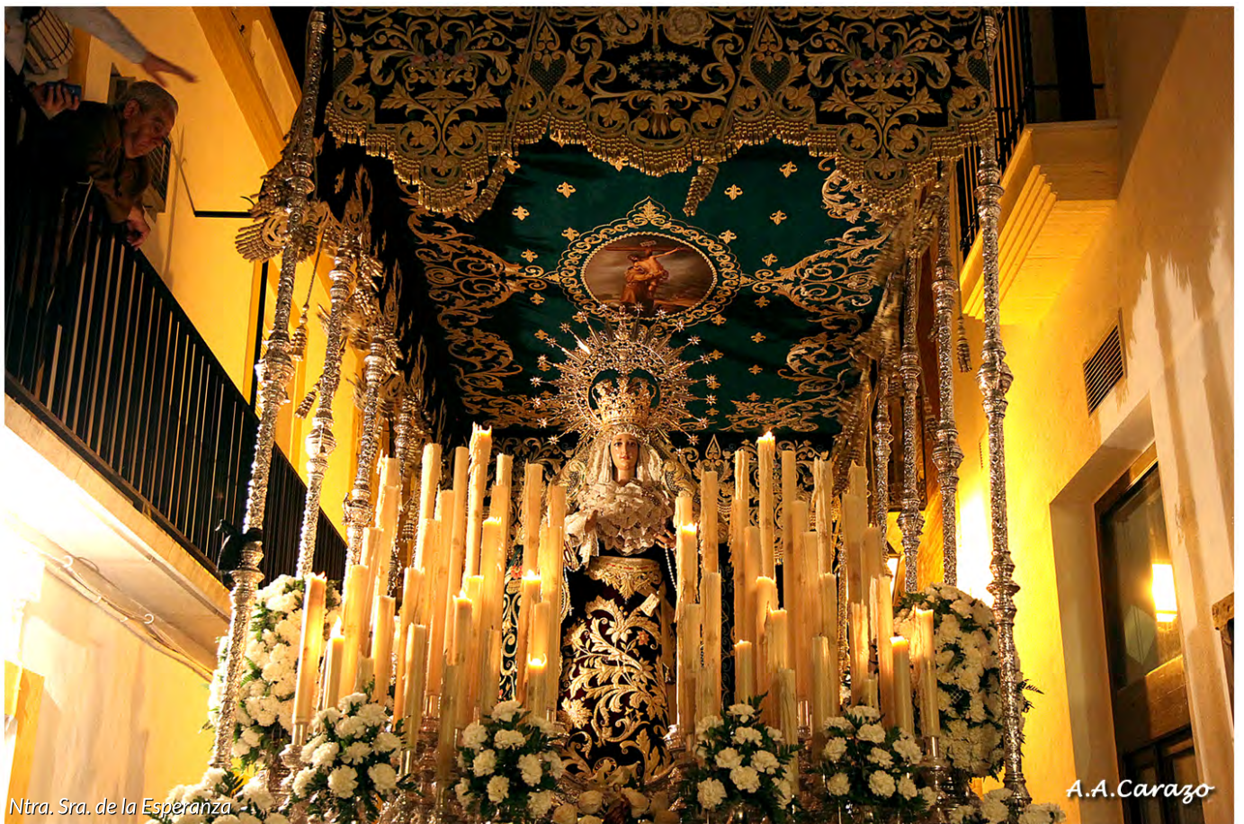
Penitente hermandad del Santo Vía Crucis