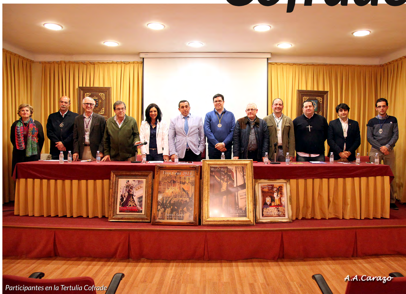
Participantes en la Tertulia Cofrade

El pasado 21 de Marzo de 2014 tuvo lugar, en los salones de SAFA, una tertulia cofrade, organizada por la Agrupación de Hermandades y Cofradías de Bujalance, de las Cofradías de Pasión junto con la Hermandad de Ntro. Padre Jesús Resucitado y la Hermandad de la Semana Santa Chiquita. Dicha tertulia fue grabada por la Televisión Municipal, con la moderación de Miguel Navarro, los cuales se ofrecieron de forma desinteresada.