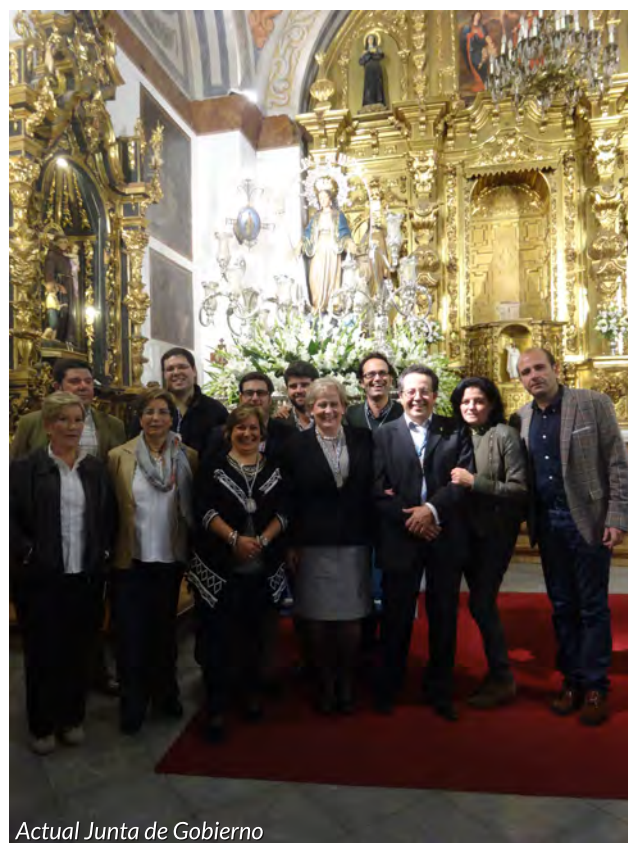
Actual Junta de Gobierno