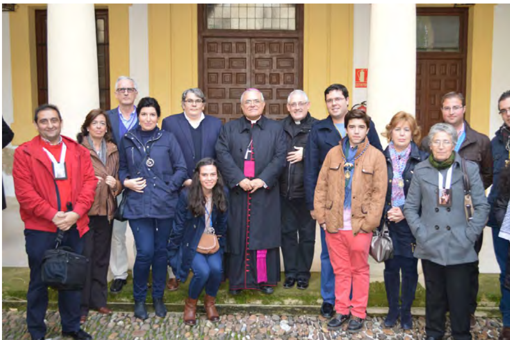
Representantes de las cofradías con el Sr. Obispo