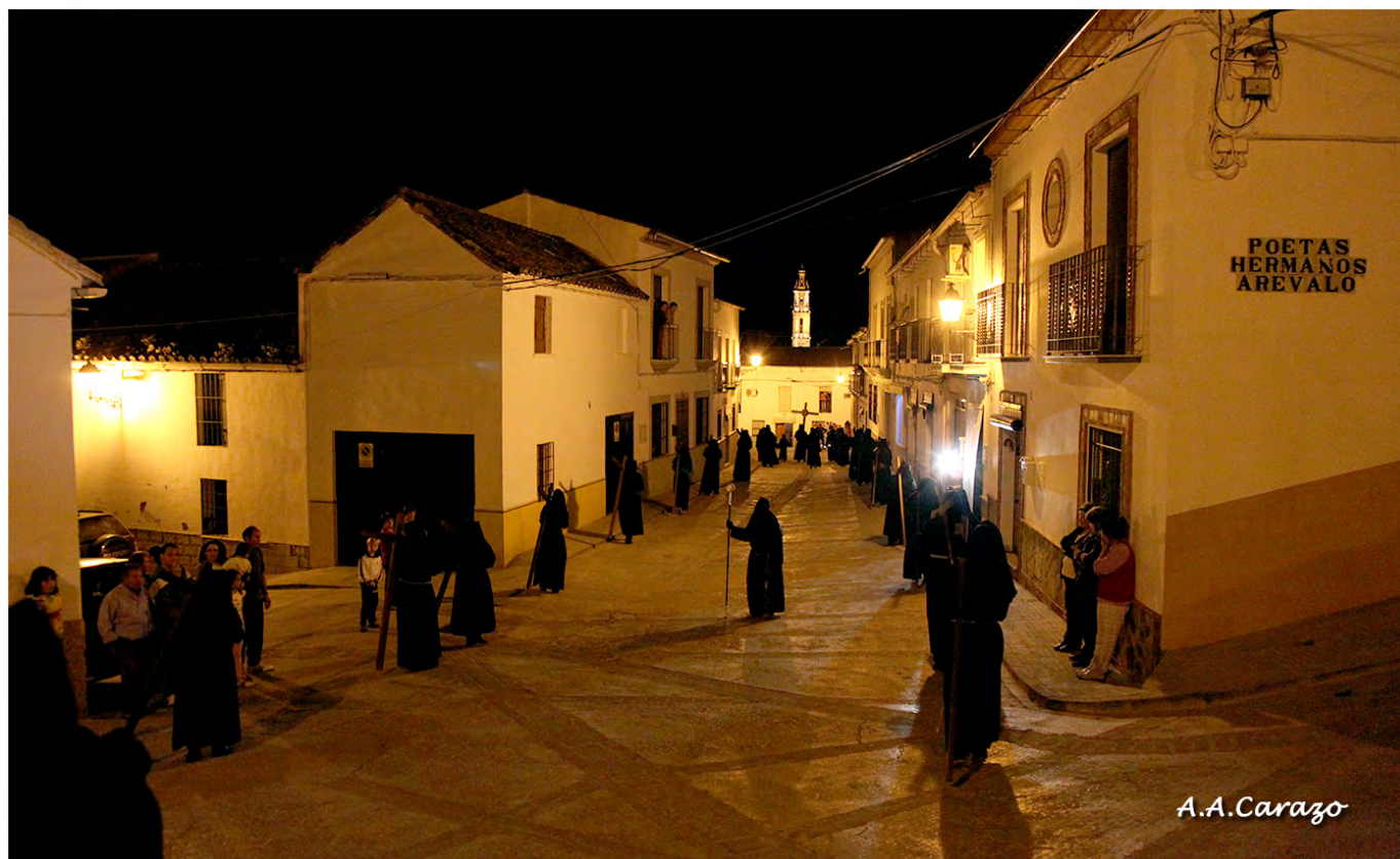
Nazarenos de la Hermandad del Santo Vía Crucis

Una vez cesada la Junta de Gobierno y constituida la nueva, se levantará y firmará por las dos partes un acta de cesión de todos los bienes y documentos pertenecientes a la Agrupación.