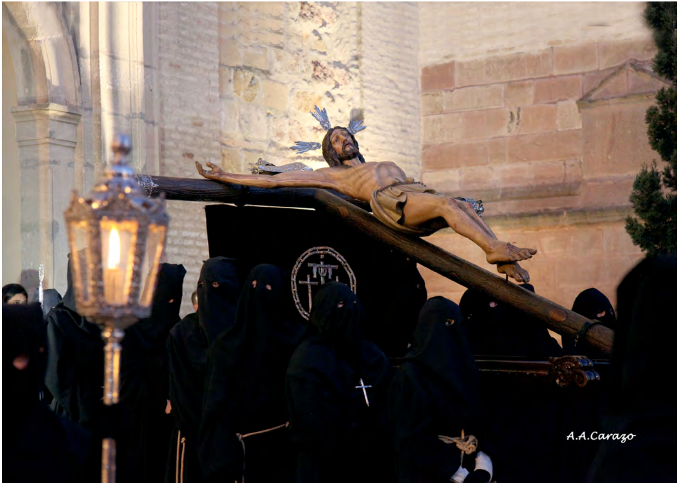
Stmo. Cristo del Amor y la Misericordia