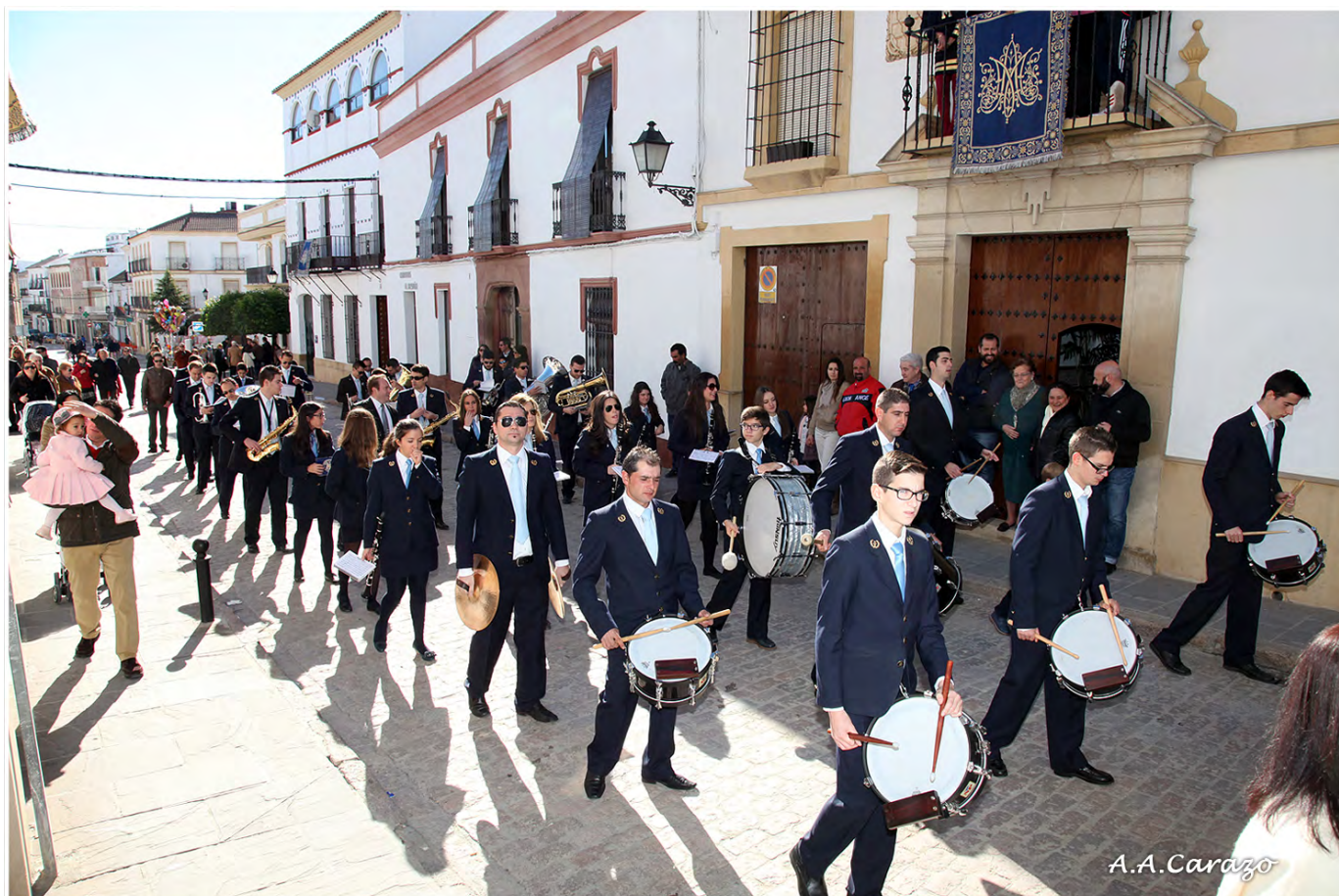
Banda de la AMC "Pedro Lavirgen"