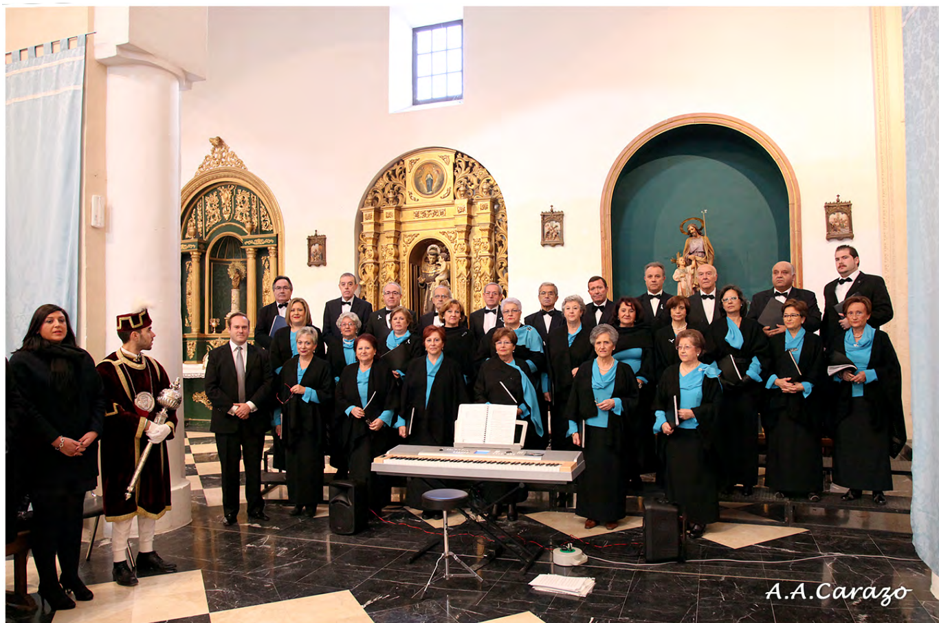
Coral de la AMC "Pedro Lavirgen" en la misa en honor a nuestra Patrona