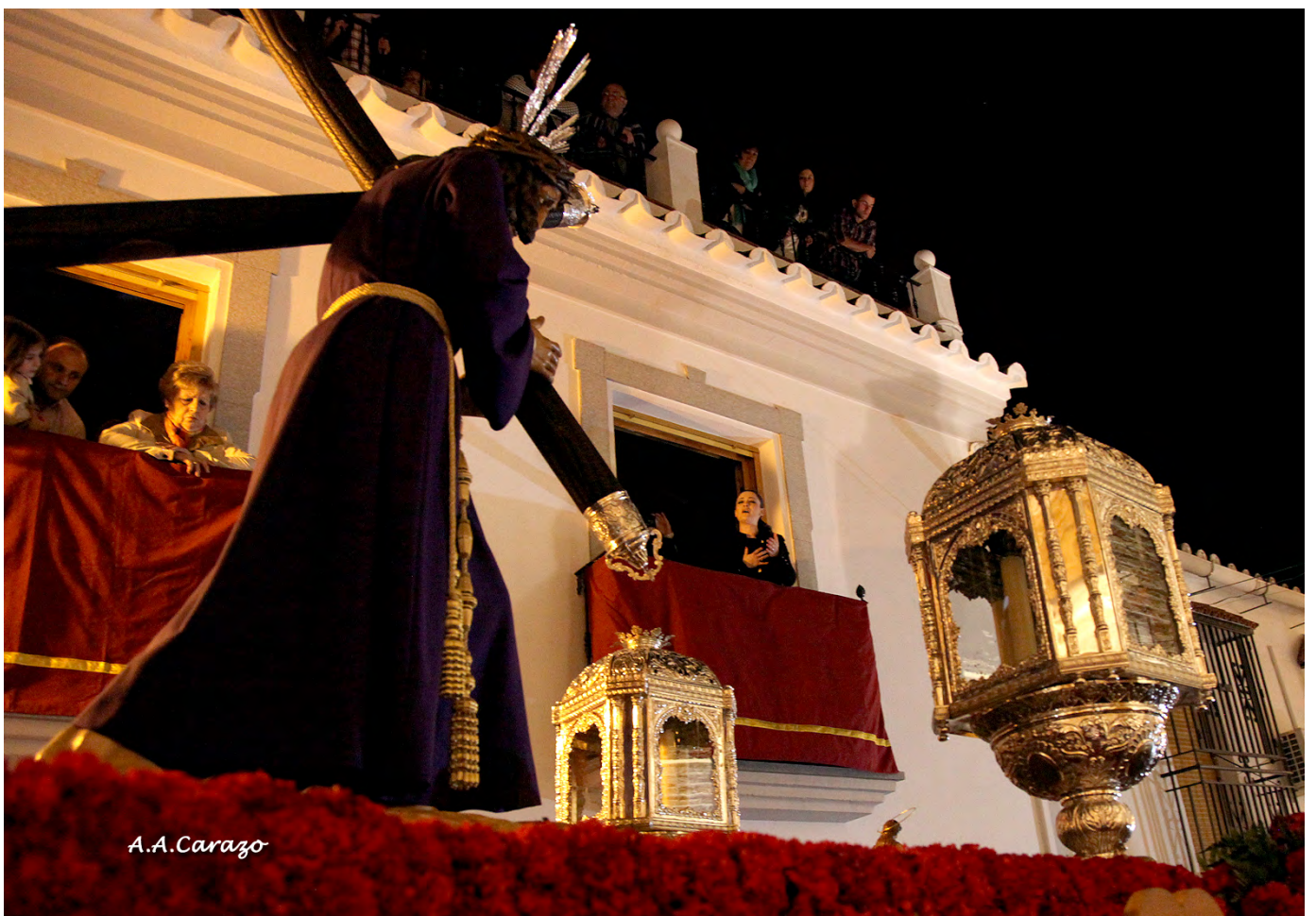
Saeta en la calle Carmelitas