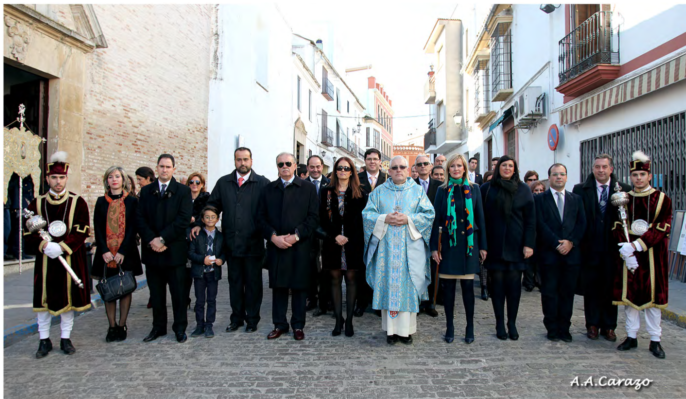
Autoridades en la Procesión de la Inmaculada del Voto