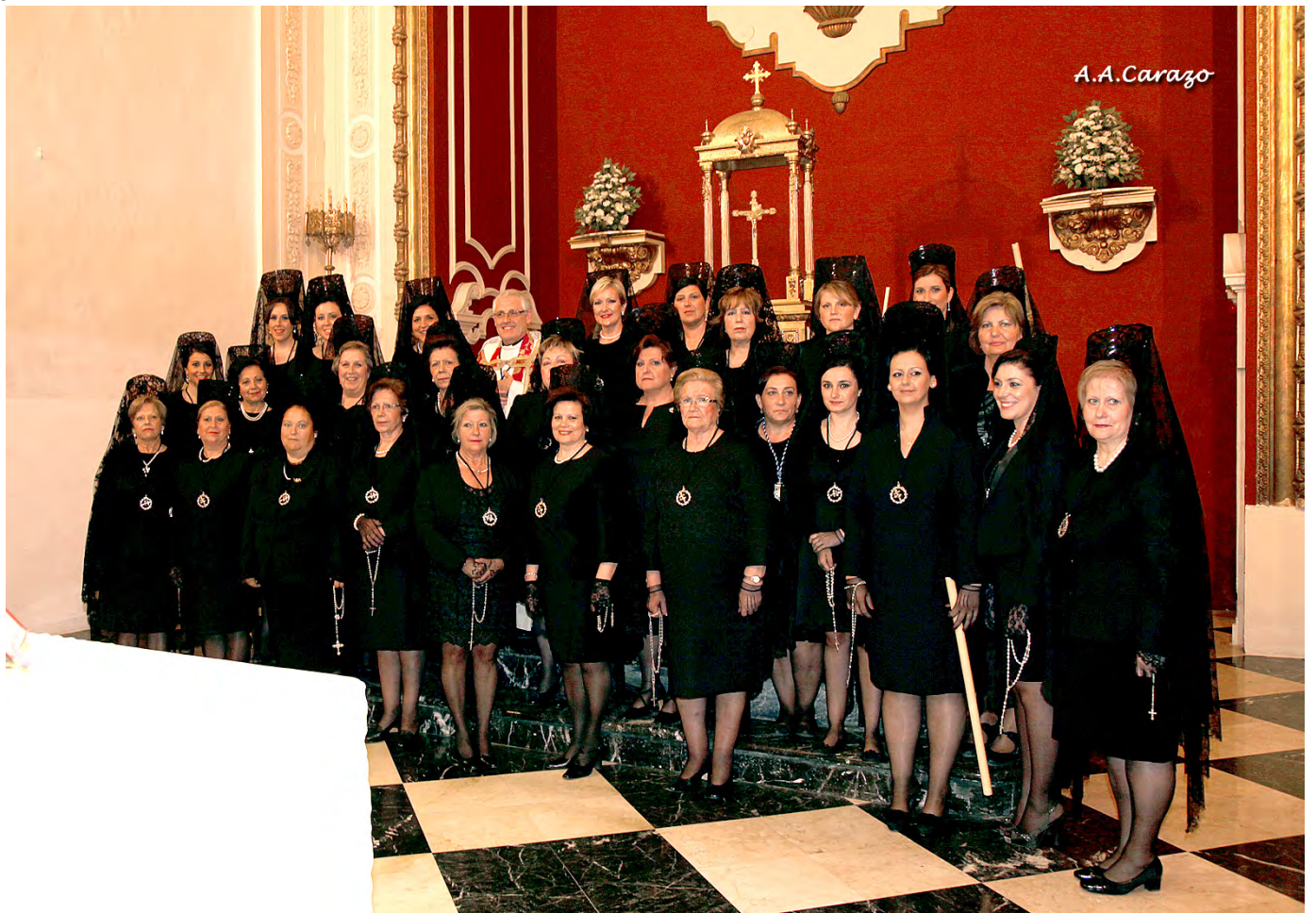
Mantillas Viernes Santo