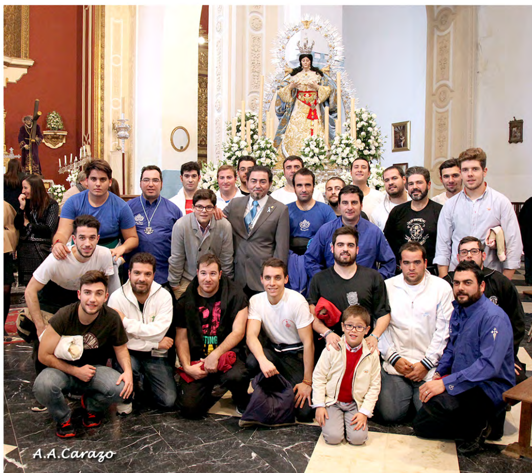
Cuadrilla costaleros de la Procesión de la Inmaculada del Voto