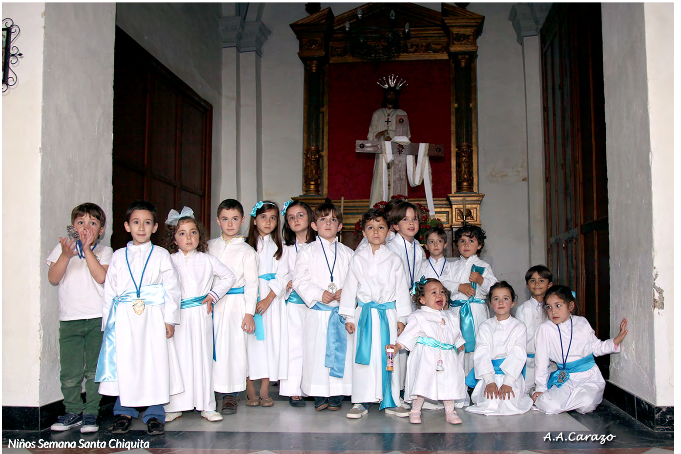
Niños Semana Santa Chiquita