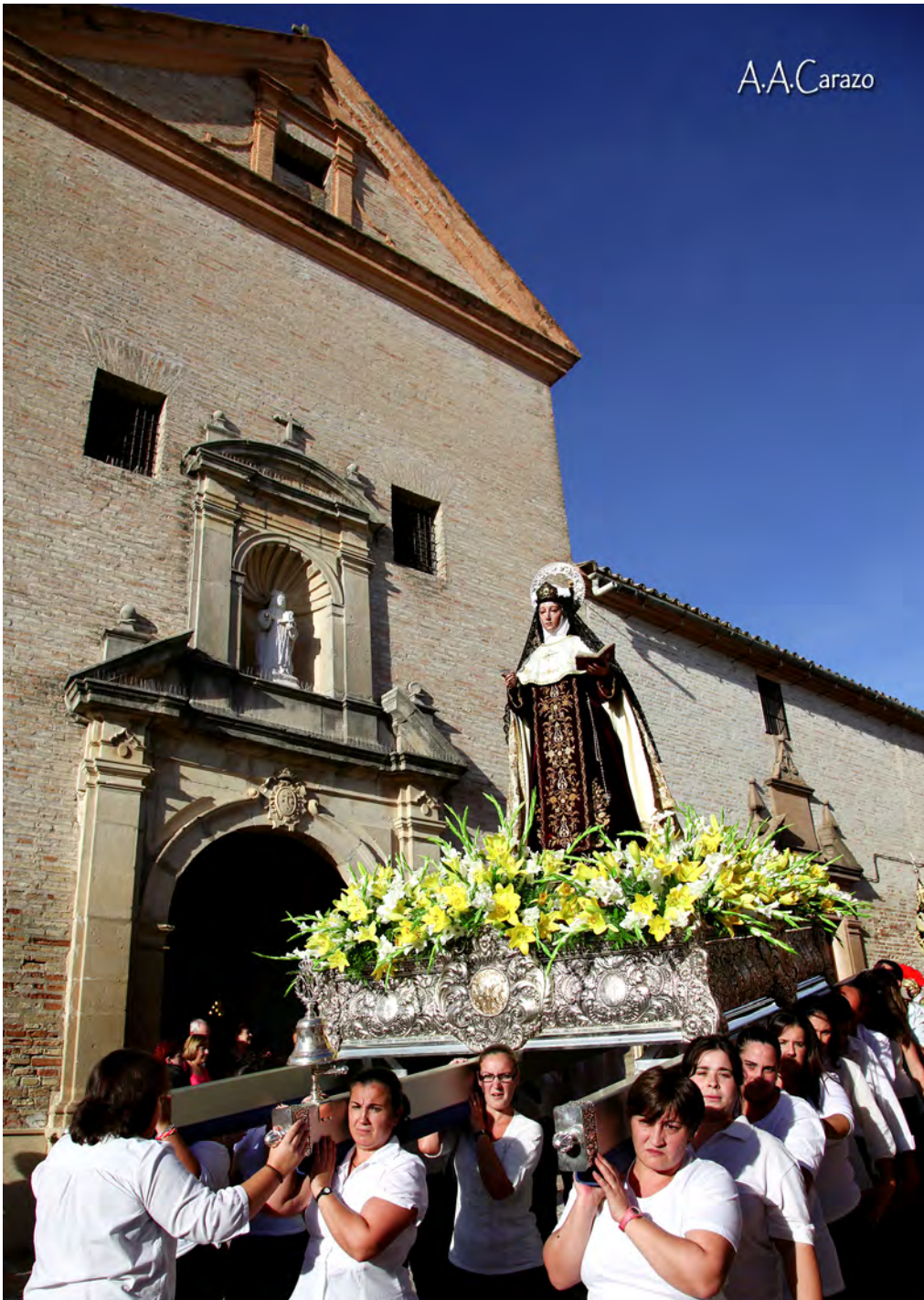
Santa Teresa de Jesús. Año de la Fe 2013

No sabemos si la santa de Ávila llegaría a descubrir y a participar en su vida del emergente mundo cofrade, lo que sí sabemos es que su fortaleza, su paciencia, o su magnanimidad, nos serán cada vez más necesarias para caminar por este mundo que nos ha tocado vivir como verdaderos discípulos de Cristo. Sin duda alguna, la Iglesia nos pide hoy que seamos más y mejores cofrades. Cofrades al estilo de santa Teresa. Cofrades teresianos.